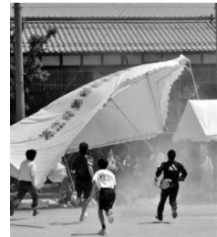
平成22年5月 滋賀県における突風被害