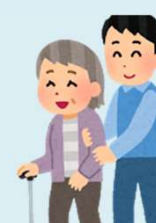
マッチング支援の実施