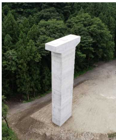
完成した(仮称)泉沢川橋の橋脚