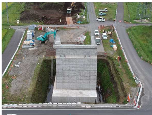
完成した(仮称)厚田IC橋の橋台