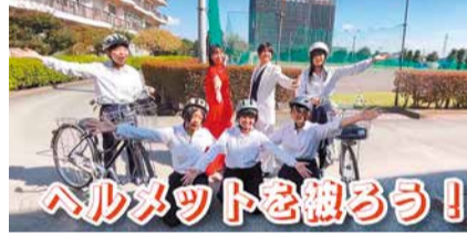
県立高崎女子高校演劇部3班の「交通安全ミュージカル劇場」