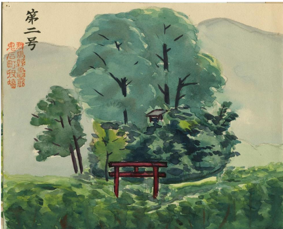
2号墳の水彩全景 (多野郡鬼石町)