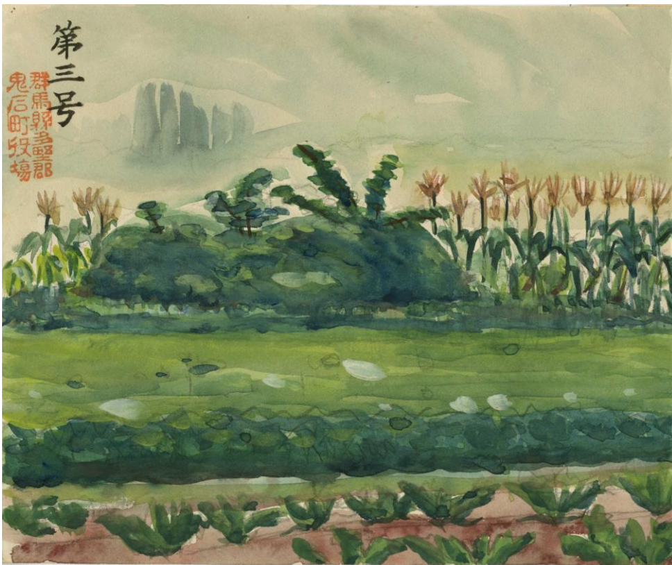
3号墳の水彩全景(多野郡鬼石町)