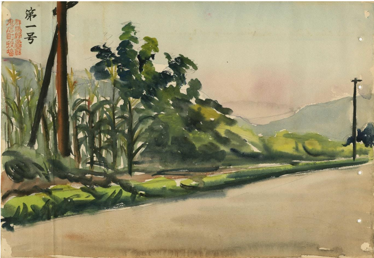
1号墳の全景スケッチ (多野郡鬼石町)