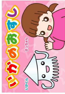
(協力: Kirakira イラスト: 山口美那枝)

県や県警察では、防犯に役立つ動画を作成して県公式YouTubeチャンネル「tsulunოს」で公開しています。ぜひご覧ください。