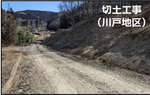
切土工事 (川戸地区)