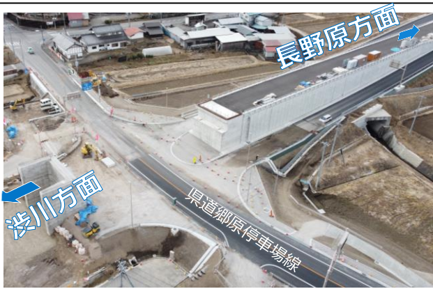
厚田IC交差点の工事状況

厚田ICの交差点新設工事として、現在、県道郷原停車場線では、道路照明や道路標識、舗装工事等を行っています。