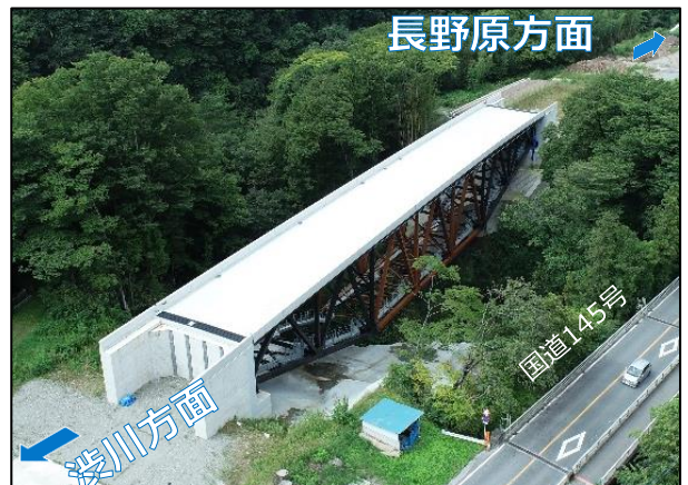
完成した上信大国橋

上信自動車道建設事務所ホームページでも情報を掲載していますので、是非ご覧ください。