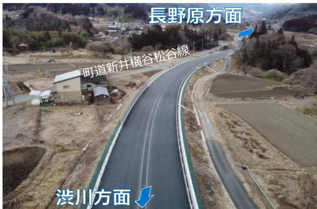
新井地区の進捗状況

片側交互通行等、大変ご迷惑をおかけしておりますが、今後も、現場の案内に従って通行していただくよう、よろしくお願い致します。