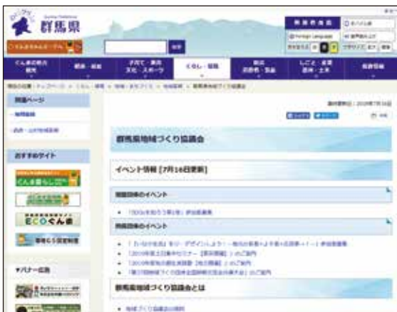
群馬県地域づくり協議会ホームページ http://www.pref.gunma.jp/04/b1510056.html