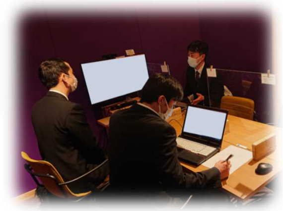
令和4年度相談会の様子

「脱炭素の基礎的な情報を知りたい」、 「相談会に申し込むのは敷居が高い」 という事業者様は、一度県職員が御相談に応じますので、以下問合せ先までお気軽に御連絡ください！