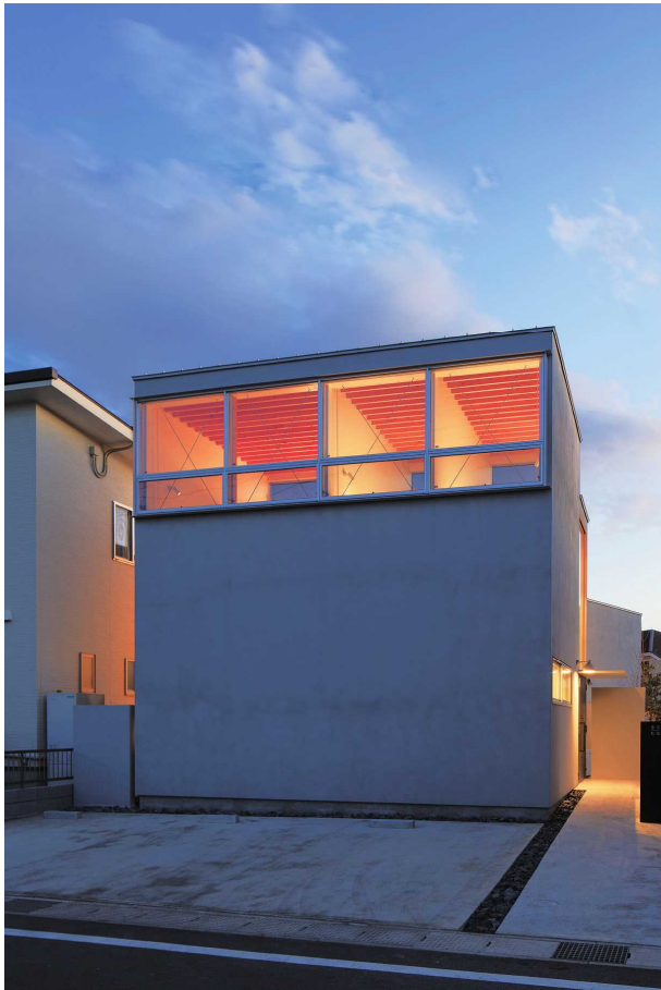
鈴木研一写真事務所