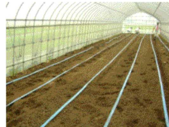
かん水 チューブ 設置