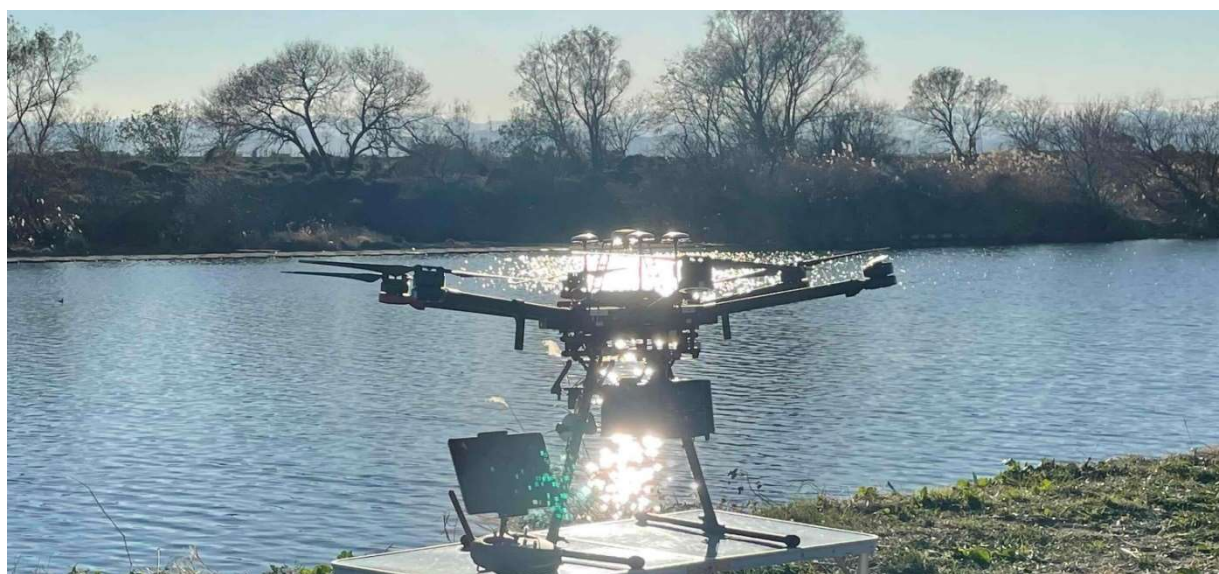
東毛工業用水道事務所 UAV（ドローン）による河川測量