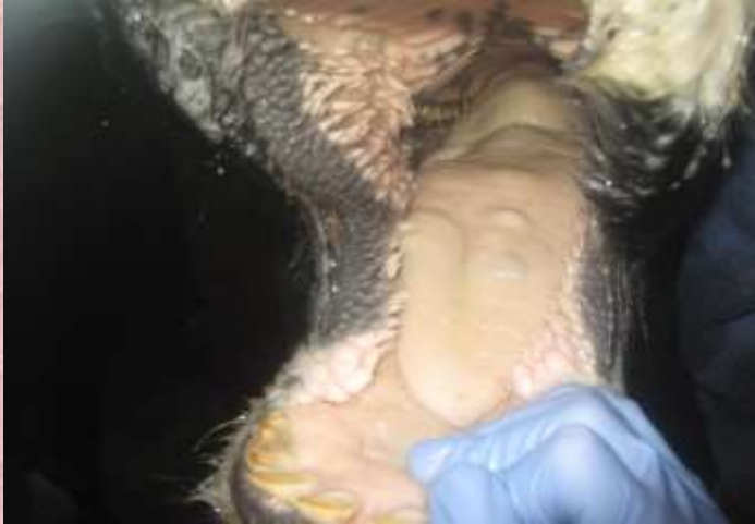
口内の水ぶくれ(初期の症状)