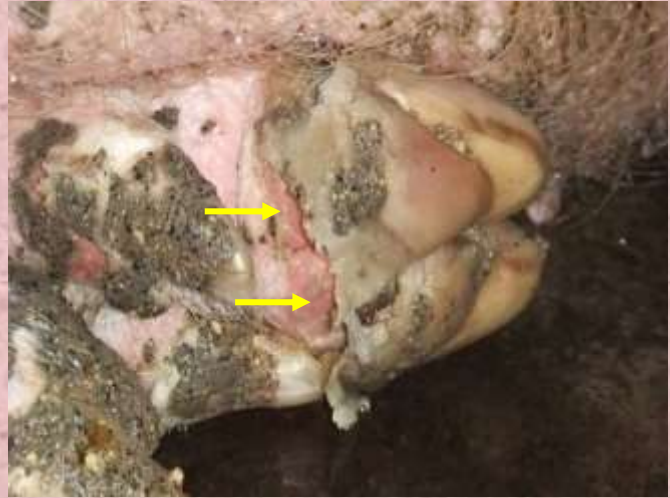
蹄部の水ぶくれの破れ