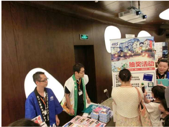
「Visit Japan Salon 上海」（上海国際貿易センター）【HIS上海と共同出展】