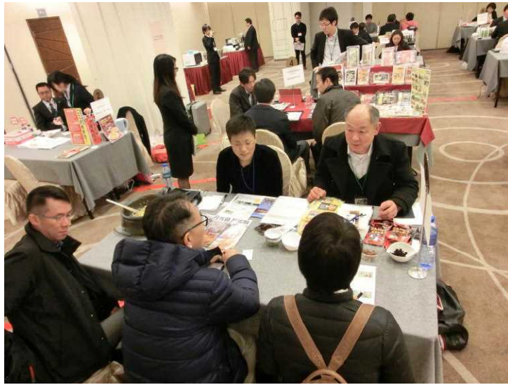
【JTБ 西日本：香港商談会】