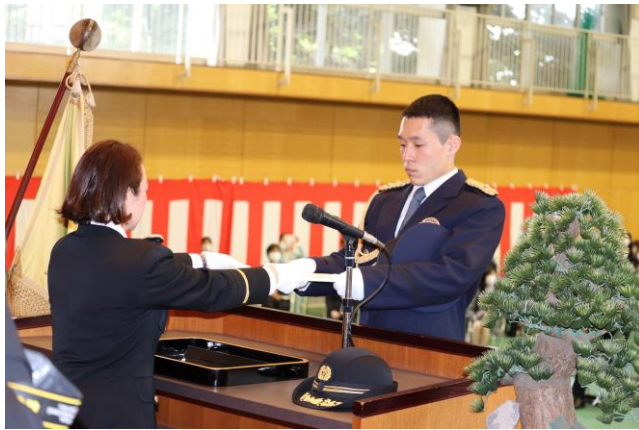
令和5年4月7日 群馬県警察学校合同入校式