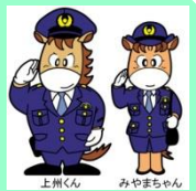
上州くん みやまちゃん

群馬県警では通学路等で発生した不審者情報や交通安全情報などを「上州くん安全・安心メール」でEメール配信しています。配信を希望される方は右の「二次元コード」からアクセスのうえ登録していただき、自主防犯活動などにお役立てください。