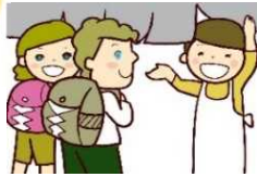
商店や 企業の 経営者