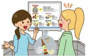
自治会や 地域を支える方