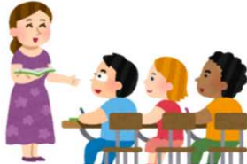
学校や 幼稚園の 先生