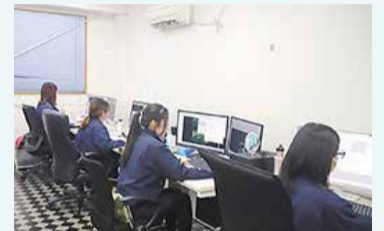
金型加工のデータを作成する様子

デジタル技術を活用した熟練ノウハウの標準化や業務の自動化、業務管理の「見える化」のためのシステムを開発しました。