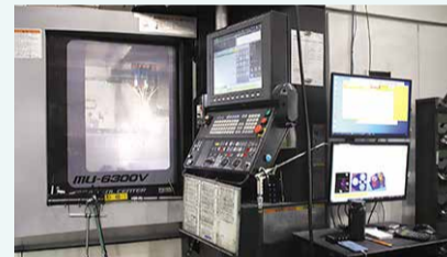
作成された加工データで金型を加工する機械

人為的ミス削減させ、生産性が1.5倍以上に上昇し、案件によっては納期が2分の1に短縮されました。面倒な作業が減り、時間や心の余裕が生まれた社員が、本業である金型加工技術の向上に一層力を入れてくれるようになりました。デジタル化により生産性が高まることで、社員の技術力もアップし、さらに生産性が上がるという好循環が生まれています。