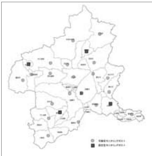
図2-4-4-1 モニタリングポスト配置図