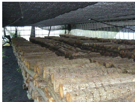
安全な原木、ほだ木の確保