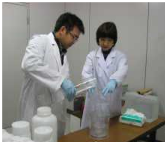
水道水放射性物質検査

その結果、事故直後に最大62ベクレル毎キログラムの放射性ヨウ素及び最大1.20ベクレル毎キログラムの放射性セシウムが検出されましたが平成23年6月3日以降は、全て不検出となっています。