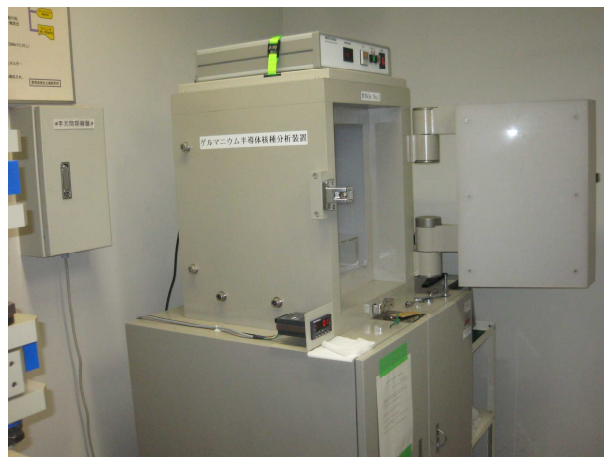
ゲルマニウム半導体検出器 (食品等の放射性物質濃度を測定します)

(注18) 試買品＝流通・販売されている食品を検査するために消費者の視点から買い上げたものをいいます。