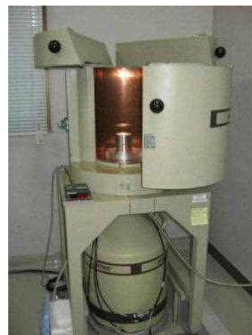
ゲルマニウム半導体検出器