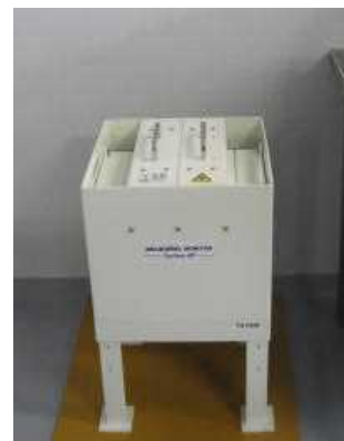
教育事務所に設置されているNaIシンチレーション検出器