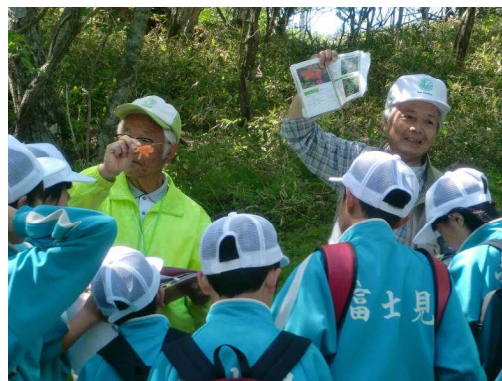
写真：小中学生のためのフォレストリースクール