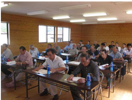
参加実績及び予定：12 団体 97 名