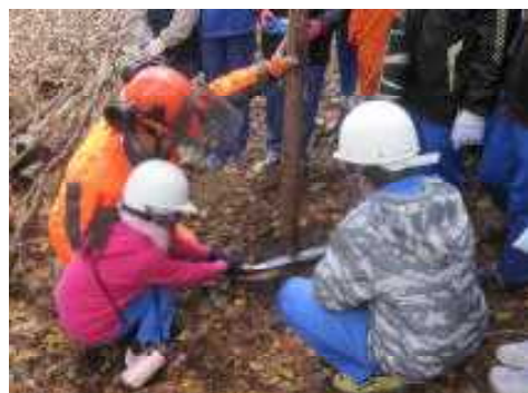
「緑のインタープリター」の活動（フォレストリースクール）