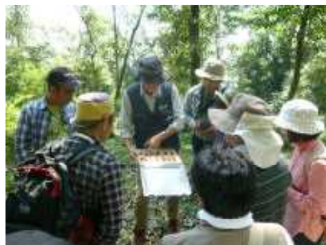
「緑のインタープリター」養成講座