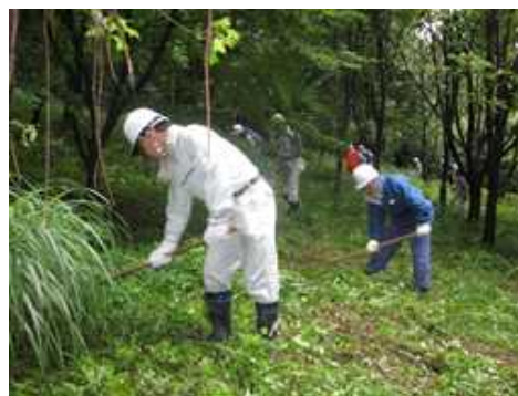
森林ボランティア体験会