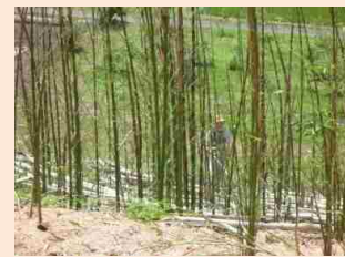
地域による取組状況