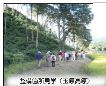
整備箇所見学(玉原高原)