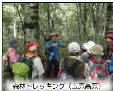
森林トレッキング(玉原高原)