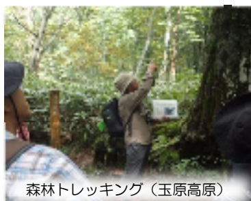
森林トレッキング(玉原高原)