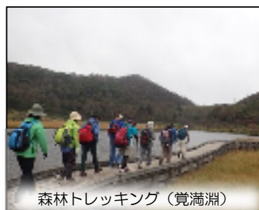
森林トレッキング(覚満淵)