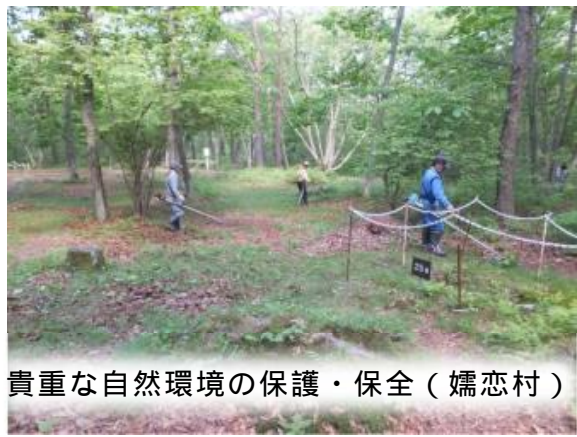
貴重な自然環境の保護・保全（孺恋村）