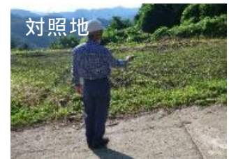
相対照度測定の様子