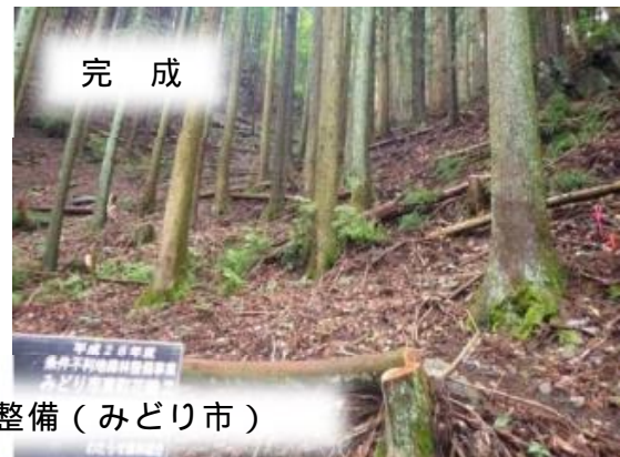
条件不利地等の森林整備（みどり市）