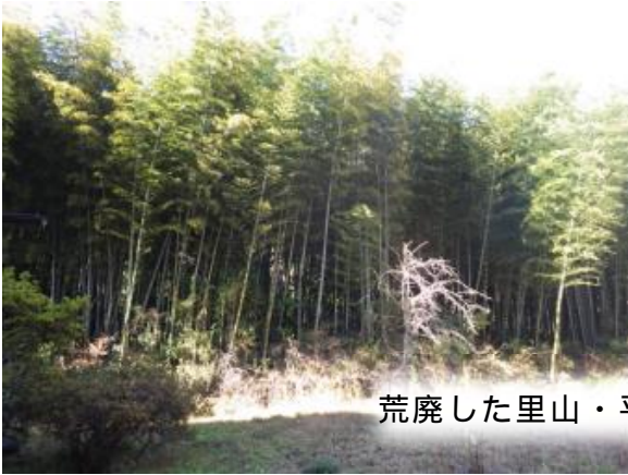
荒廃した里山・平地林の整備（みどり市）