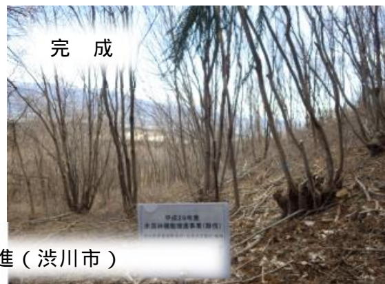
水源林機能増進（渋川市）