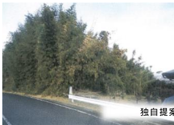
独自提案事業（渋川市）