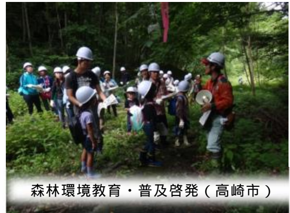
森林環境教育・普及啓発（高崎市）