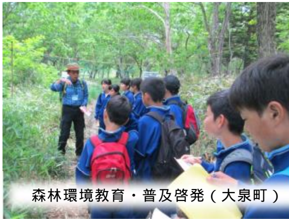
森林環境教育・普及啓発（大泉町）