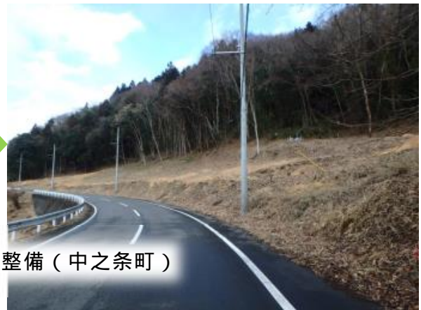
荒廃した里山・平地林の整備（中之条町）