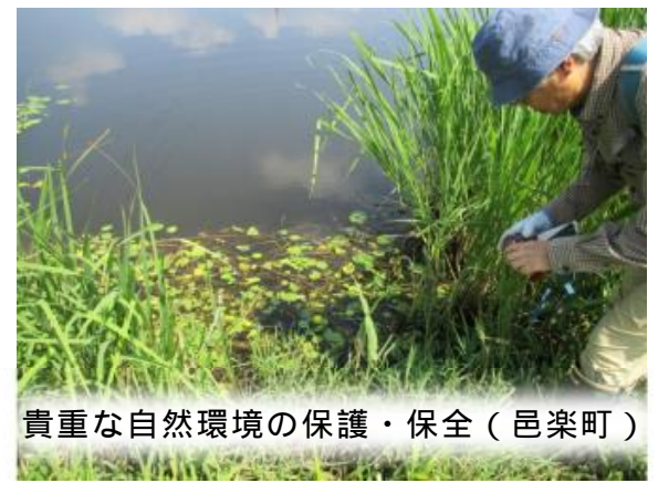
貴重な自然環境の保護・保全（邑楽町）