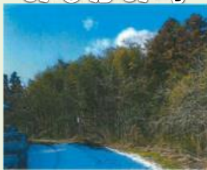
みな7 向原地区竹林整備事業