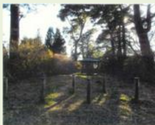
前橋4 宮城地区参道 松並木森林整備事業