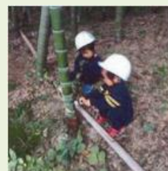
高崎5 親子竹工作体験・ ネイチャークラブ体験