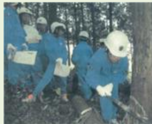
藤岡 18 林業体験教室