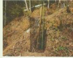
下仁14 土谷沢(七久保) 森林整備