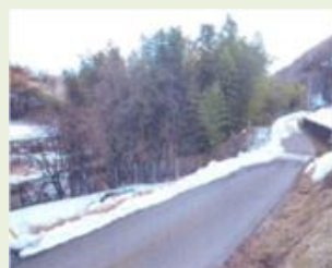
片品2 里山整備事業