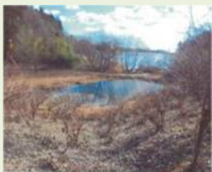
高崎2 鳴沢湖周辺環境保護・ 保全及び啓発活動事業