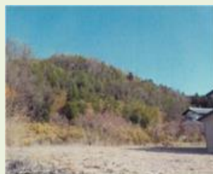
富岡 2 里山再生事業