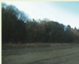
東吾1 小泉地区竹林伐採事業