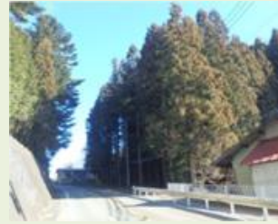
中之22 五反田白久保 県道東森林整備