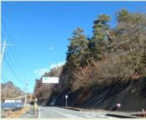
中之18 伊勢町古垣内松林 整備事業