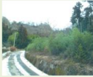
昭和4 椽久保森林管理事業