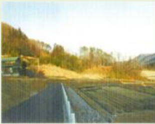
長野原2 草木原地区竹林 整備事業(管理)