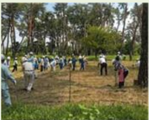
館林1 多々良アカマツ 植樹体験事業