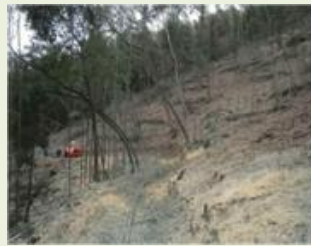
みど3 小平地区竹林 管理事業