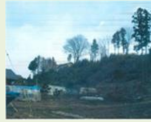
昭和8 森下森林管理事業