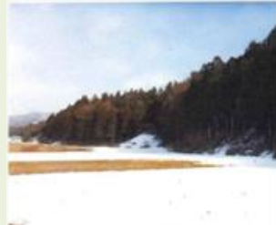
川場2 川場村森林整備事業