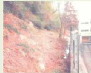
沼田12 上久屋町森林 管理事業