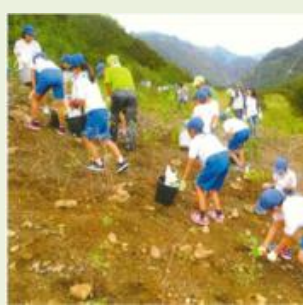
邑楽1 自然体験活動支援 事業(高島小学校)