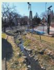
前橋11 野メダカを育てる会 補助事業