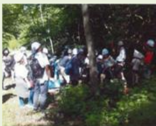
高崎3 倉渕親子自然体験 ツアー