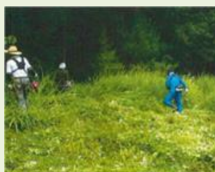
高山21 高山村竹林整備事業