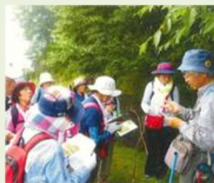
邑楽4 自然観察教室支援事業 (長柄公民館)