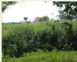
館林8 蛇沼湿原環境 整備事業