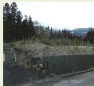
みな18 上原地区里山管理事業