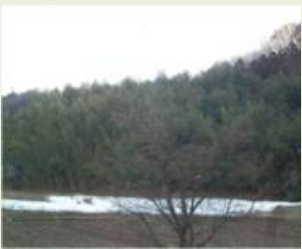
みな4 下矢瀬地区竹林整備事業