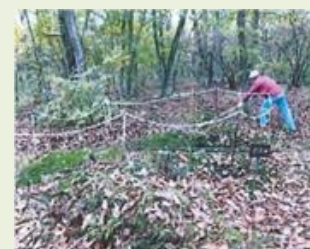
高山22 高山村地区里山・ 平地林整備事業