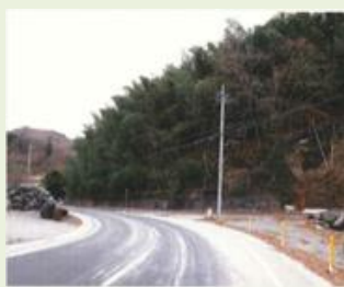
甘楽1 下引田竹林整備