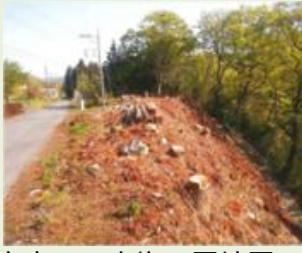
安中6 土塩1区地区 (山ノ神)