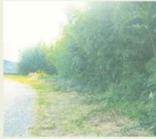
渋川 1 竹林整備事業