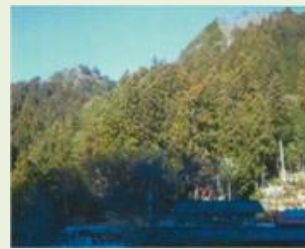
南牧8 南牧村林地荒廃対策 整備支援事業