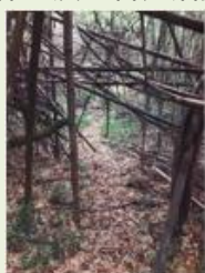
高崎8 竹林整備事業