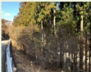
上野6 上野村里山景観 整備事業