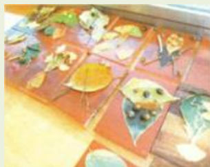
前橋16 夏休みみどりの教室