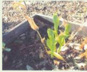
伊勢4 波志江町一丁目地区内 キンラン・ギンラン生息地保護事業