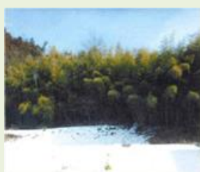
川場1 川場村竹林整備事業