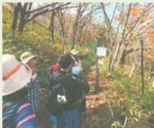
明和4 森林・野草観察教室