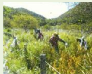
前橋9 甦らせよう覚満淵の希少 植物