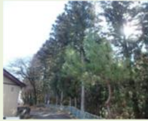
中之20 折田小川団地周辺 森林整備事業