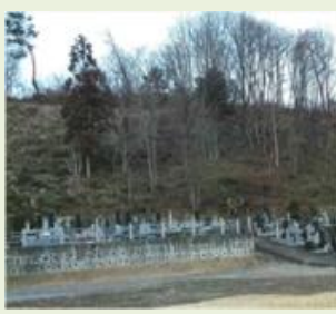
みな17 今宿地区里山管理事業