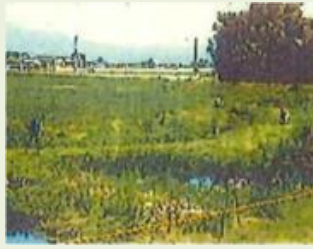
伊勢1 八寸権現山森林環境 教育事業