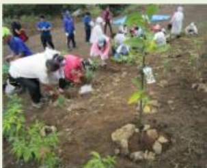
館林5 足尾フィールドワーク