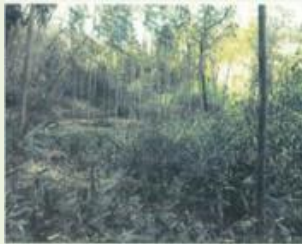
藤岡 1 高山社跡周辺整備事業