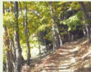
吉岡1 金剛寺跡周辺 森林管理事業