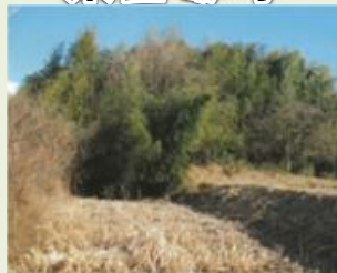
東吾4 小田沢地区竹林伐採事業