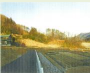
草津1 「草津・白根冬の自然 学校」冬の森林体験ツアー