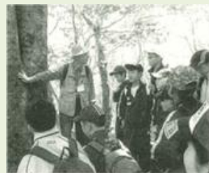
板倉1 自然体験教室