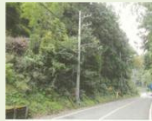
下仁27 青倉(番匠免) 森林整備