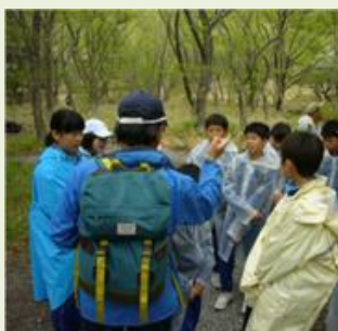
大泉1 ぐんま緑の県民基金 自然体験活動支援事業