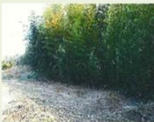
玉村1 下茂木地区竹林伐採事業