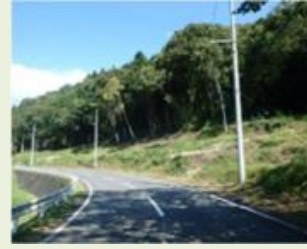
中之13 池田地区竹林 整備事業管理作業