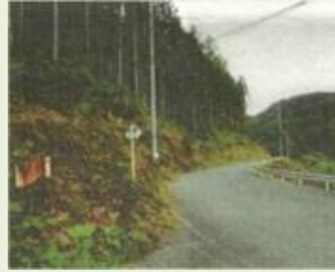
下仁8 上蒔田 (三本杉)森林整備