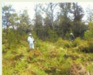
前橋5 松枯れ林地再生事業