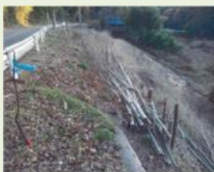
高崎27 H28竹林整備事業 (管理)