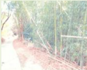
沼田1 下沼田町竹林整備事業