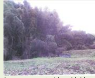
安中12 国衙地区竹林 整備事業