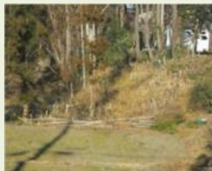
東吾13 上之宮地区竹林管理事業