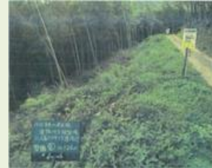
藤岡 13 八塩ハイキング道周辺整備事業