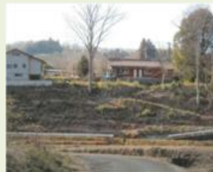
東吾6 新巻地区竹林管理事業