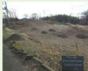
東吾20 萩生地区竹林管理事業