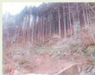
神流5 間物地区 森林管理事業