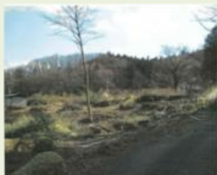
東吾9 山根地区竹林整備事業