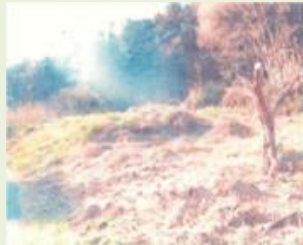
沼田5 追貝地区森林 管理事業