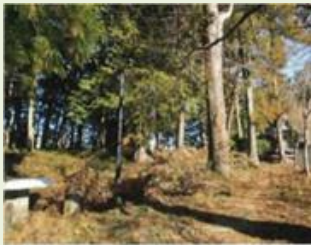
榛東1 榛東八幡ホタルの郷 周辺整備(管理)