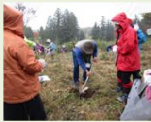
千代田1 森林体験ツアー