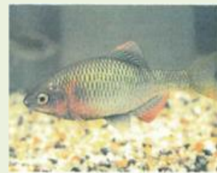
藤岡 21 旧笹川をきれいにする事業