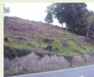
片品12 里山整備事業