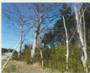
明和1 斗合田オオタカの森 竹林整備