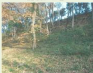
桐生1 荒廃した里山・平地林の 整備