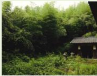
太田1 菅塩町竹林整備事業