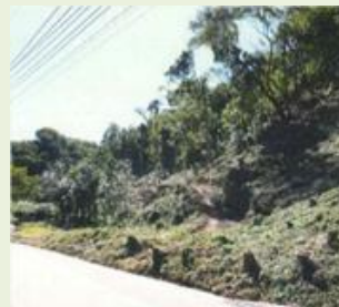
甘楽4 甘楽総合公園西側 竹林整備