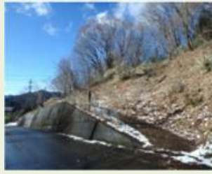
中之9 紅葉山周辺竹林整備