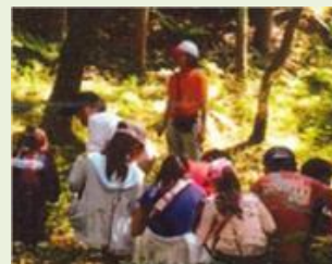
前橋17 ぐんま緑の県民基金 自然体験種別支援事業