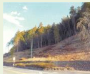
富岡 5 里山再生事業