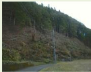
南牧4 大塩沢高原地区林地 荒廃対策整備支援事業