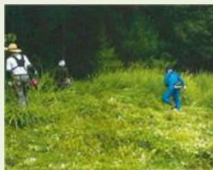
嬭恋3 大前区森林管理事業