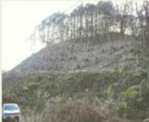
下仁17 下町(伊勢山) 森林整備