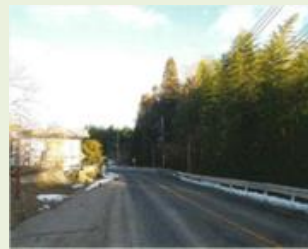
みな10 上岩淵地区森林整備事業