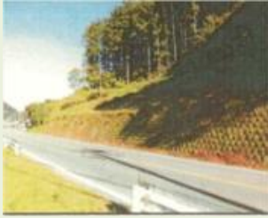
下仁3 大桑原(森上) 森林整備