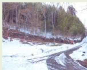
片品1 里山整備事業