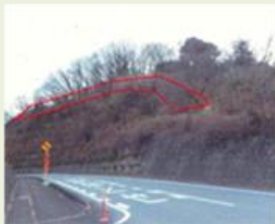
藤岡 16 犬間森林保全業