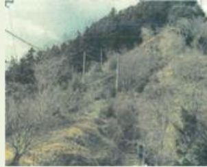
藤岡 8 二千階段周辺整備事業