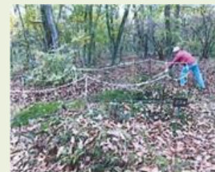
嬭恋5 ギンラン等希少植物 保護活動支援事業