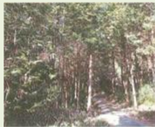
下仁25 中小坂(大泓) 森林整備