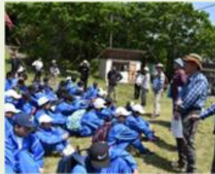
太田2 森林環境教育・自然 観察会