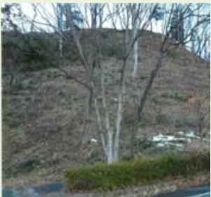
みな12 みなかみ町里山管理事業