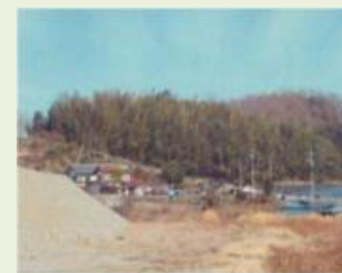
富岡 8 里山再生事業