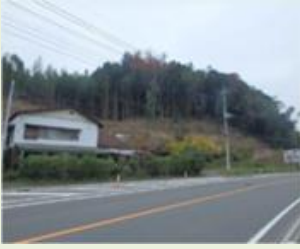
中之2 下市城竹林整備事業 管理作業