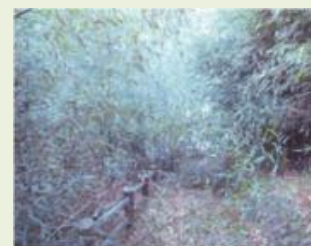
神流15 神ヶ原恐竜センター 下竹林伐採事業