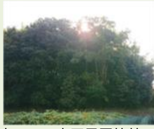
安中11 大王子区竹林 整備事業