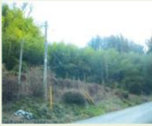
昭和1 昭和村森林整備事業(川額)