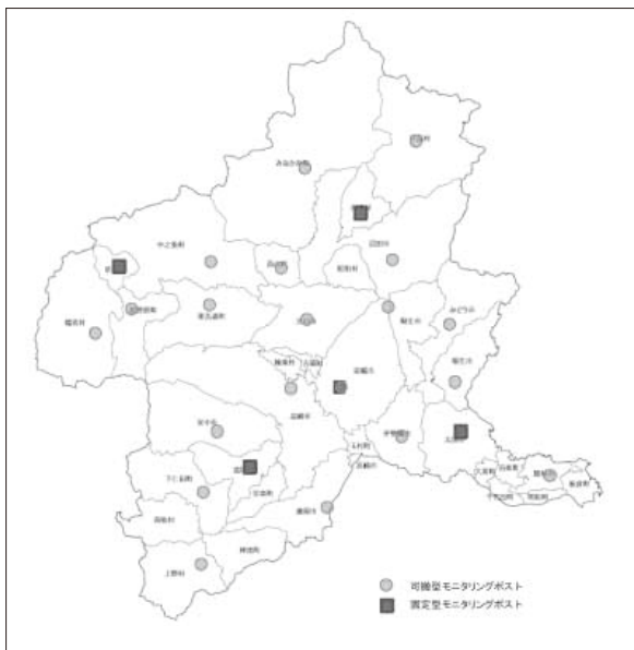
図2-4-4-1 モニタリングポスト配置図