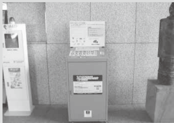
県庁舎1階県民ホールロビー設置回収ボックス

プロジェクト終了後も、市町村が行う使用済小型家電の回収に引き続き御協力をお願いします。