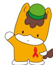
群馬県の マスコット 「ぐんまちゃん」

http://www.pref.gunma.jp/02/d2900269.html