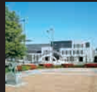
団地内にある板倉東洋大前駅