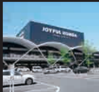
ジョイフル本田千代田店に隣接

※ふれあいタウンちよだは2つのエリアがあり、群馬県企業局と千代田町が分譲しています。