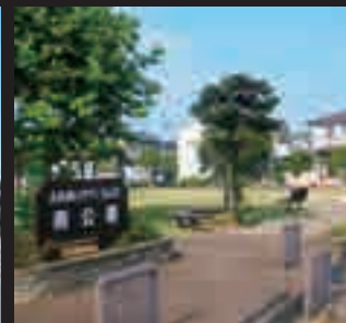
公園と緑に囲まれた快適な暮らし