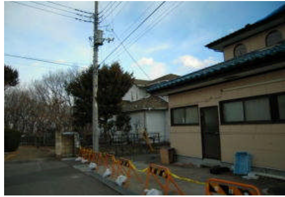
宅地被害による立入禁止措置＝3月、渋川市軽浜団地内