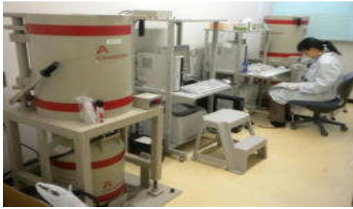
※農業技術センター ゲルマニウム半導体検出器