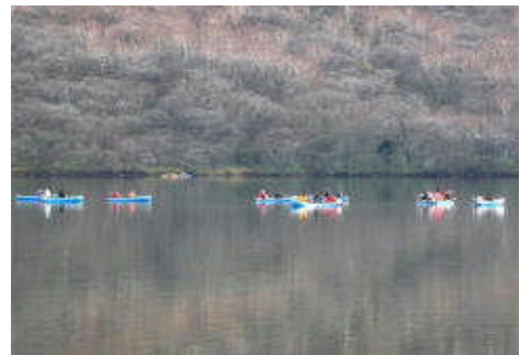
※赤城大沼における検体採捕状況

検査魚の採捕については、漁場管理者（漁業協同組合や市町村など）や養殖業者に依頼し、採捕後の放射性物質の検査は、県または民間業者で実施した。