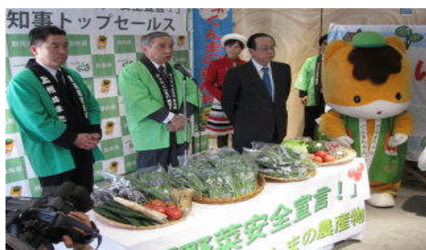
知事による「野菜安全宣言」 4月12日（ぐんまちゃん家）