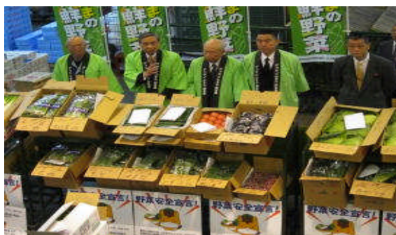
4月19日（東京都中央卸売市場（築地市場））

香港のスーパーや食肉事業者に対する知事トップセールスを含め、国内外における県産農畜産物の安全性PRイベント等は200回に達した。