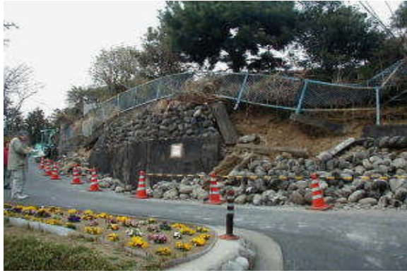
被災宅地の危険度を判定＝3月、桐生市