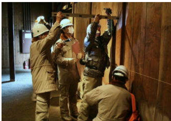
被災建物の応急危険度を判定＝3月