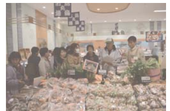
食の現場公開事業（体験型）