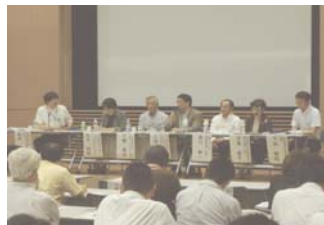
食品安全セミナーでの パネルディスカッション