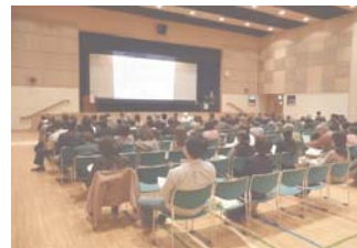
健康食品セミナー