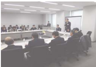
食品安全県民会議

群馬県では、消費者や事業者、学識経験者など様々な職種で構成される食品安全県民会議において、食の安全に関する事項について意見交換を行ったり、食の安全に関する県民参加・体験型のイベントなど、様々なリスクコミュニケーションの場を提供しています。