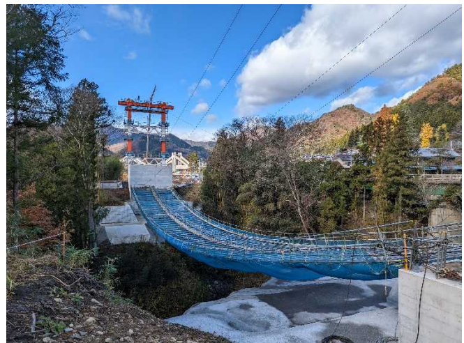
写真：ケーブル設置状況

上信自動車道建設事務所ホームページでも情報を掲載していますので、是非ご覧ください。 → http://www.pref.gunma.jp/07/m04300047.html