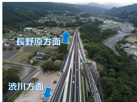
供用開始後の様子(岡崎IC付近)

整備中の区間につきましても、一日も早い開通に向け、事業を進めていく所存ですので、引き続き皆様のご理解・ご協力をお願いいたします。