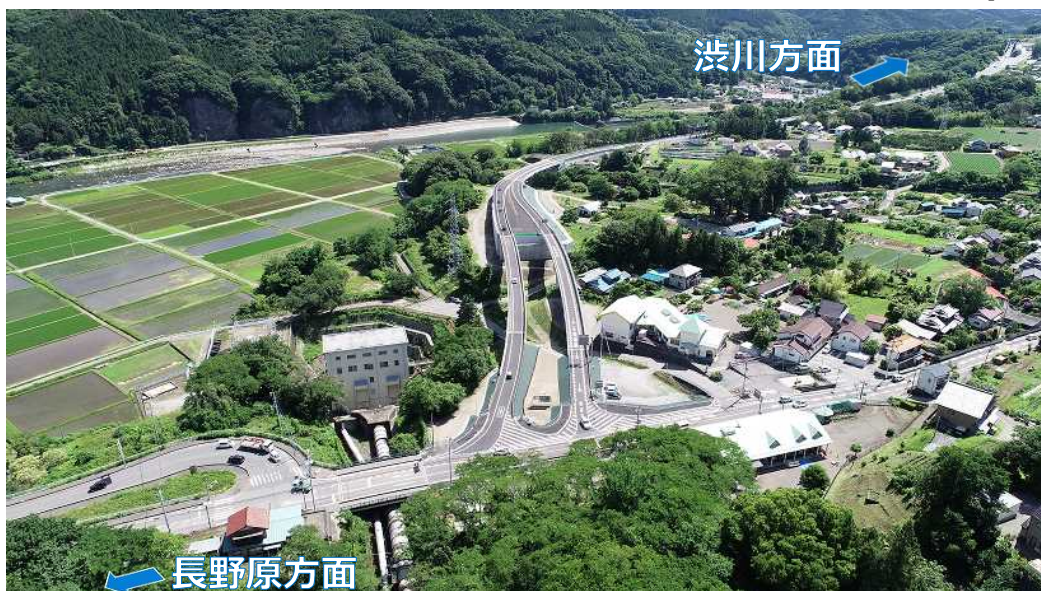
供用開始後の様子(箱島IC付近)