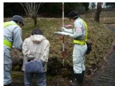
H30境界立会いの様子

また、各地区において、盛土や切土等の安全性を確認するための地質調査を実施しています。関係する方には、事前に時期及び調査箇所をお知らせしておりますので、調査へのご理解ご協力をお願いいたします。