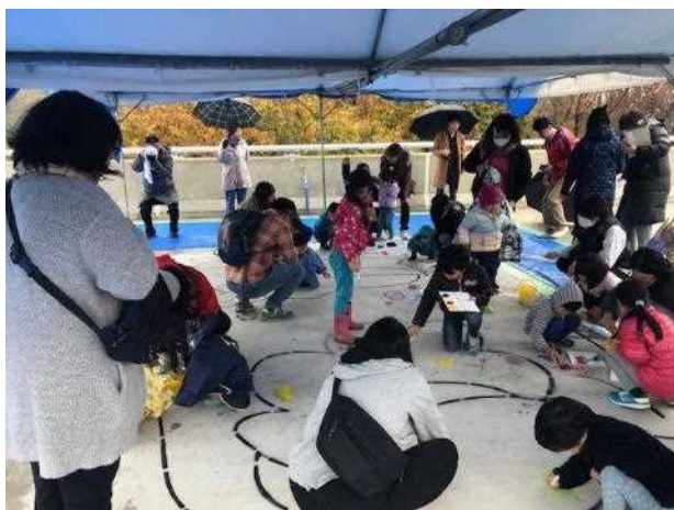
お絵かきに熱中する子供たち

令和元年11月23日、現在建設中の新金沢橋で、あづまこども園の子どもたちを対象としたお絵かき大会を実施しました。お絵かき大会には、園児や保護者など約50人が参加し、舗装を整備する前のコンクリートに、絵の具やクレヨンを使って自由に絵を描いていただきました。