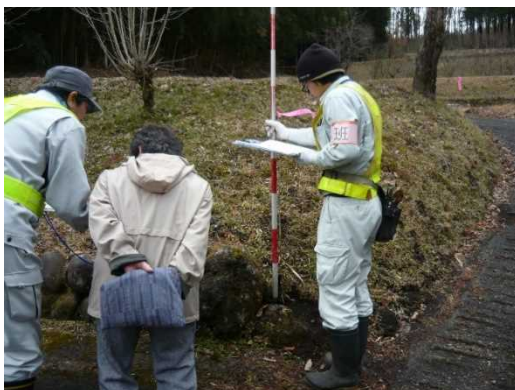
境界立会いの様子

箱島地区：平成31年3月18日（月）～22日（金） 五町田地区：平成31年3月5日（火）～8日（金） 新巻地区：平成31年3月25日（月）～28日（木） 泉沢・小泉地区：平成31年度（準備ができ次第案内いたします。）