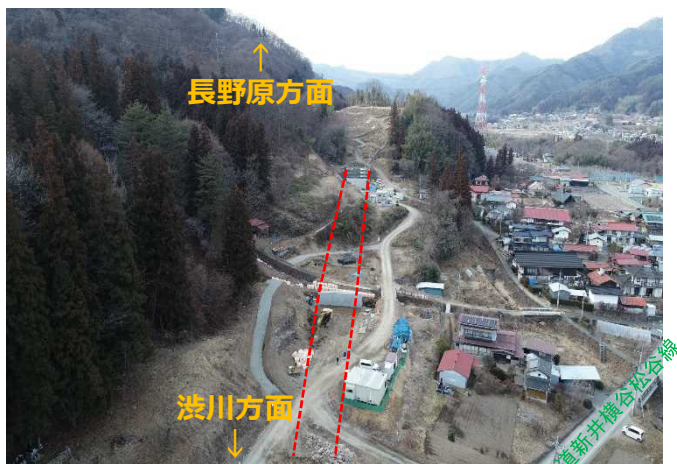
根古屋地区の様子

厚田地区や根古屋地区では、盛土工事や橋梁などの構造物の建設が進んでいます。写真のとおり、道路の線形が見えてきました。今後も工事に伴い、通行規制や迂回が行われる場所がありますので、近隣の方にはご不便をお掛けいたしますが、引き続きご理解とご協力をお願いします。