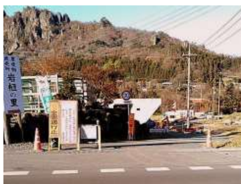
全面通行止め箇所付近（厚田）