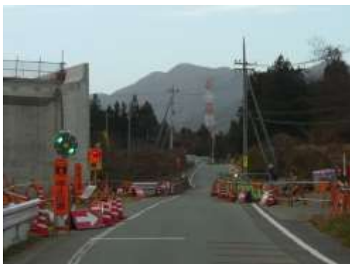
片側通行規制箇所付近（唐堀）

唐堀地区内（鳶ヶ沢橋付近）で平成30年12月10日から平成31年10月末（予定）の間で、片側通行規制を行っています。期間中は大型車両の通行ができなくなりますので、現場の案内に従い迂回をお願いします。このほかの各地区でも、工事に伴う通行止めや迂回、工事用車両の増加など地域のみなさまにはご迷惑をお掛けしますが、ご理解・ご協力をよろしくお願いします。