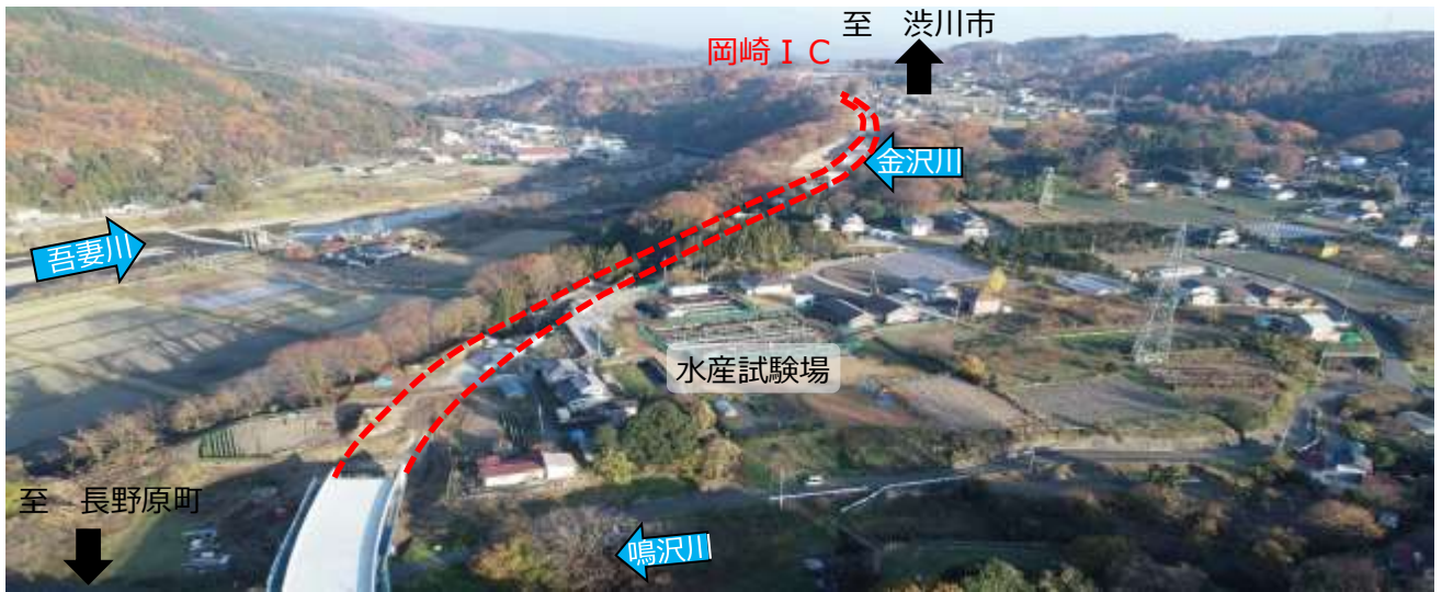
祖母島～箱島バイパス 全体路線図

平成31年度末の開通を目標に工事を進めており、橋梁などの構造物が完成してきました。そこで、工事の進捗状況を上空から撮影しました。写真のとおり、道路の線形が見えてきました。引き続き工事を進めていきますので、近隣の方にはご迷惑をお掛けしますが、ご理解・ご協力をよろしくお願い致します。