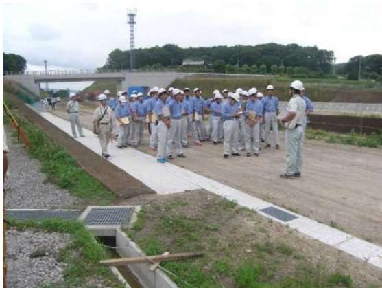
吾妻中央高校 現場見学会の様子 (7/4)

年末には、地区の皆様を対象とした見学会も開催する予定ですので、ぜひご参加下さい。