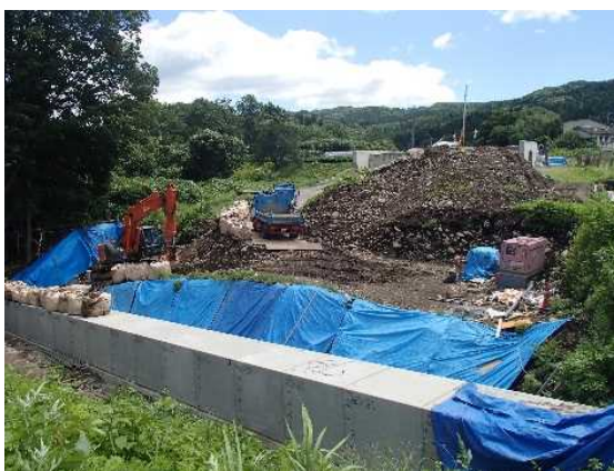
新井地区 道路築造現場 (8/17)