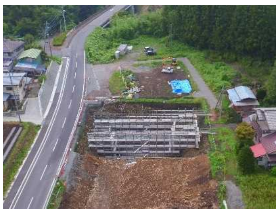
四戸地区 ボックスカルバート工 (8/29)

文化財調査が進んできたことから本格的に工事を進めていきます。万木沢地区や唐堀地区などでは、工事により通行規制が行われますが、安全には十分配慮して行いますので、皆様のご理解・ご協力をお願いします。