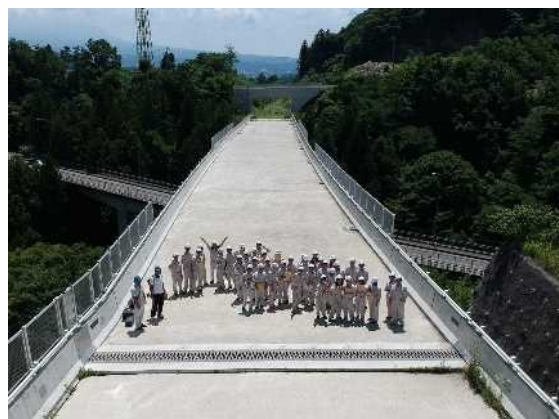
桐生工業高校 現場見学会の様子 (7/9)