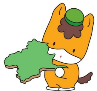
群馬県のマスコット「ぐんまちゃん」

道路計画や今後の予定に関して、不明な点等がありましたら、建設第一係（担当：鳥塚、新井）まで、連絡をお願いします。