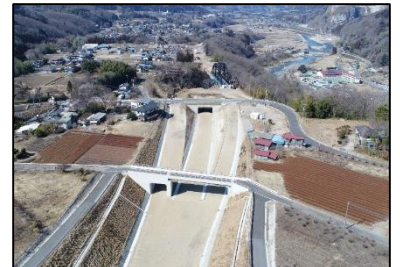
（仮称）岡崎 I C 付近の状況 （平成30年3月4日撮影）