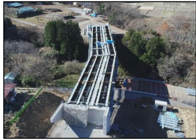
（仮称）鳴沢川橋上部工 （平成29年12月3日撮影）

平成30年3月には（仮称）鳴沢川橋や（仮称）岡崎 I C ランプ橋の上部工、町道付替工事が完成し、道路の形がみえてきました。