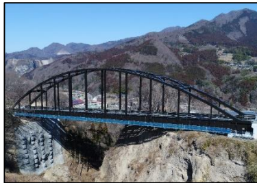
（仮称）岡崎 I C ランプ橋上部工 （平成30年3月4日撮影）