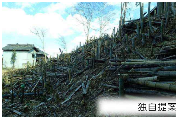
独自提案事業（高崎市）