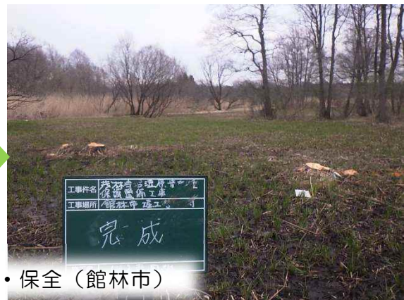
貴重な自然環境の保護・保全（館林市）