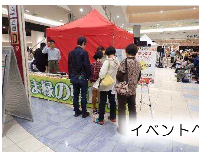
イベントへの出展