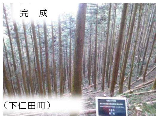
条件不利地森林整備 (下仁田町)