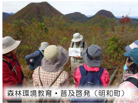
森林環境教育・普及啓発（明和町）