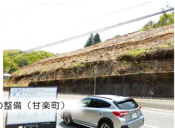
荒廃した里山・平地林の整備（甘楽町）