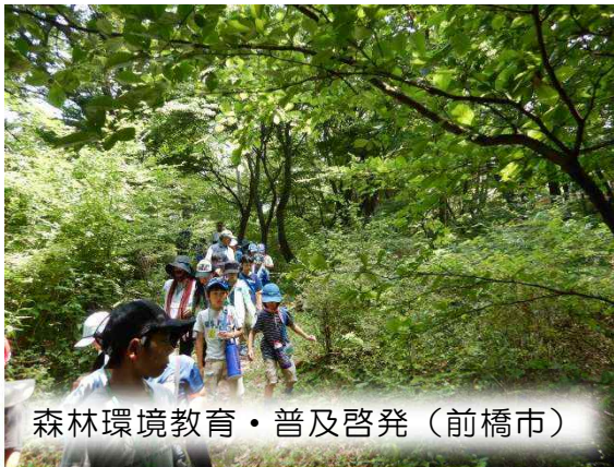
森林環境教育・普及啓発（前橋市）