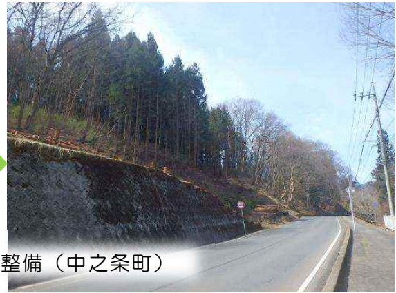
荒廃した里山・平地林の整備（中之条町）