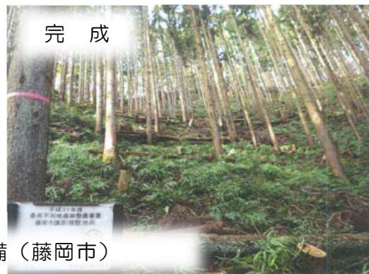
条件不利地森林整備 (藤岡市)