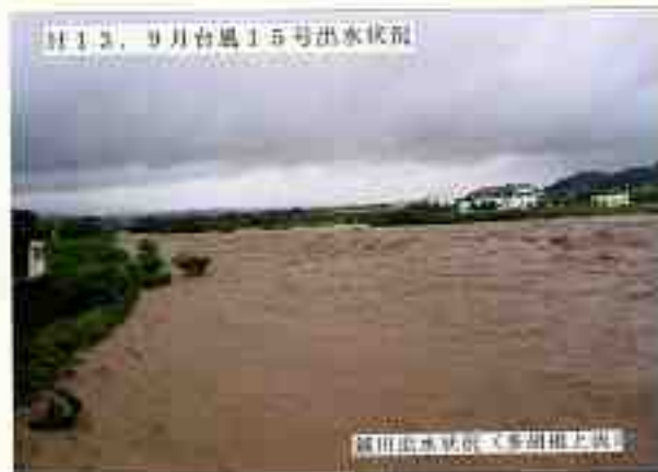
11.3. 9月台風15号洪水状況