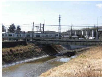
JR高崎線 利用者：約3,700人/日