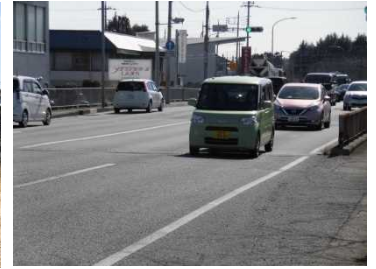
国道17号 (第1次緊急輸送路) 交通量：26,215台/日