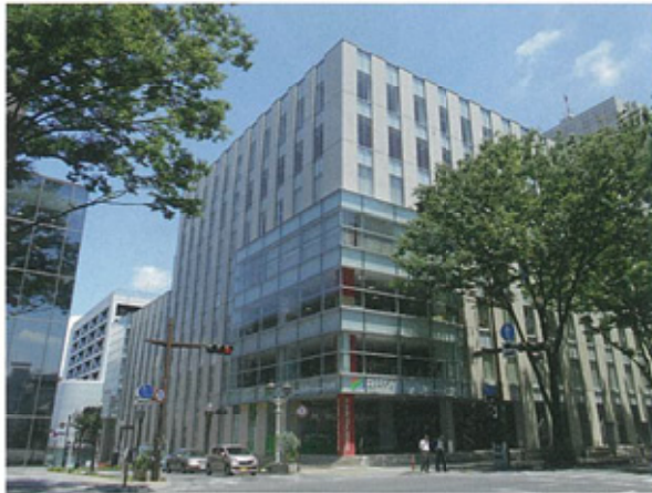
国道50号線沿いに立つ「前橋プラザ元気21」

その後、上記計画をもとに、国のまちづくり交付金(当時)を活用し、平成19年12月のリニューアルオープンに至りました。LIVIN前橋店閉店から数えて3年11ヶ月。大型公共事業としては、異例の早さで事業推進できたのは、中心市街地の表玄関と言える場所に、一日も早く活気を取り戻したいとする関係者の熱意であったと言われています。