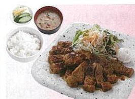
フードコート・テイクアウトメニュー