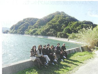
やっぱ、新居浜は、海・浜・島でしょ!!～ということ全員で…