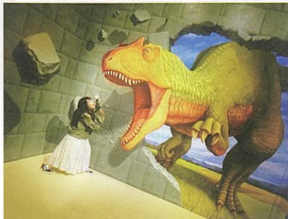
愛媛県総合科学博物館の恐竜トリックアートの前で名演技…“映える～”