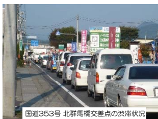
国道353号 北群馬橋交差点の渋滞状況

◆国道353号では、朝夕の通勤時間帯を中心として、交通混雑が発生しており、移動に時間がかかります。