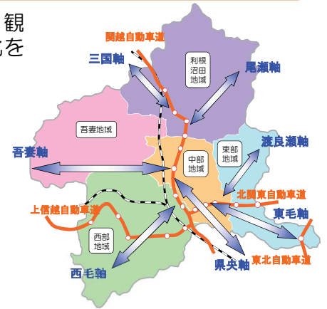
【今後10年間の7つの交通軸の整備イメージ】

高速道路ICと「主軸」を結び、更なるアクセス強化を図る「強化路線」を整備します。