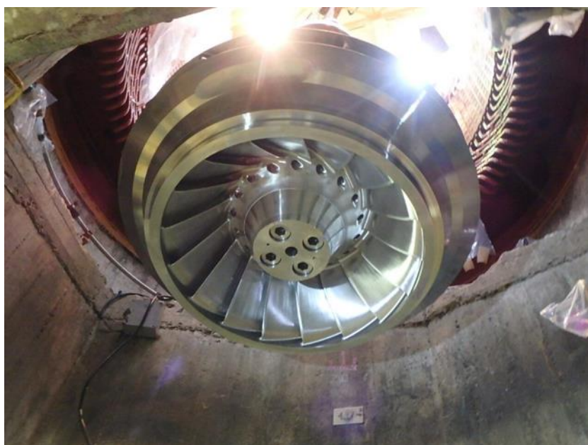
湯川発電所 吊り込み中のランナ