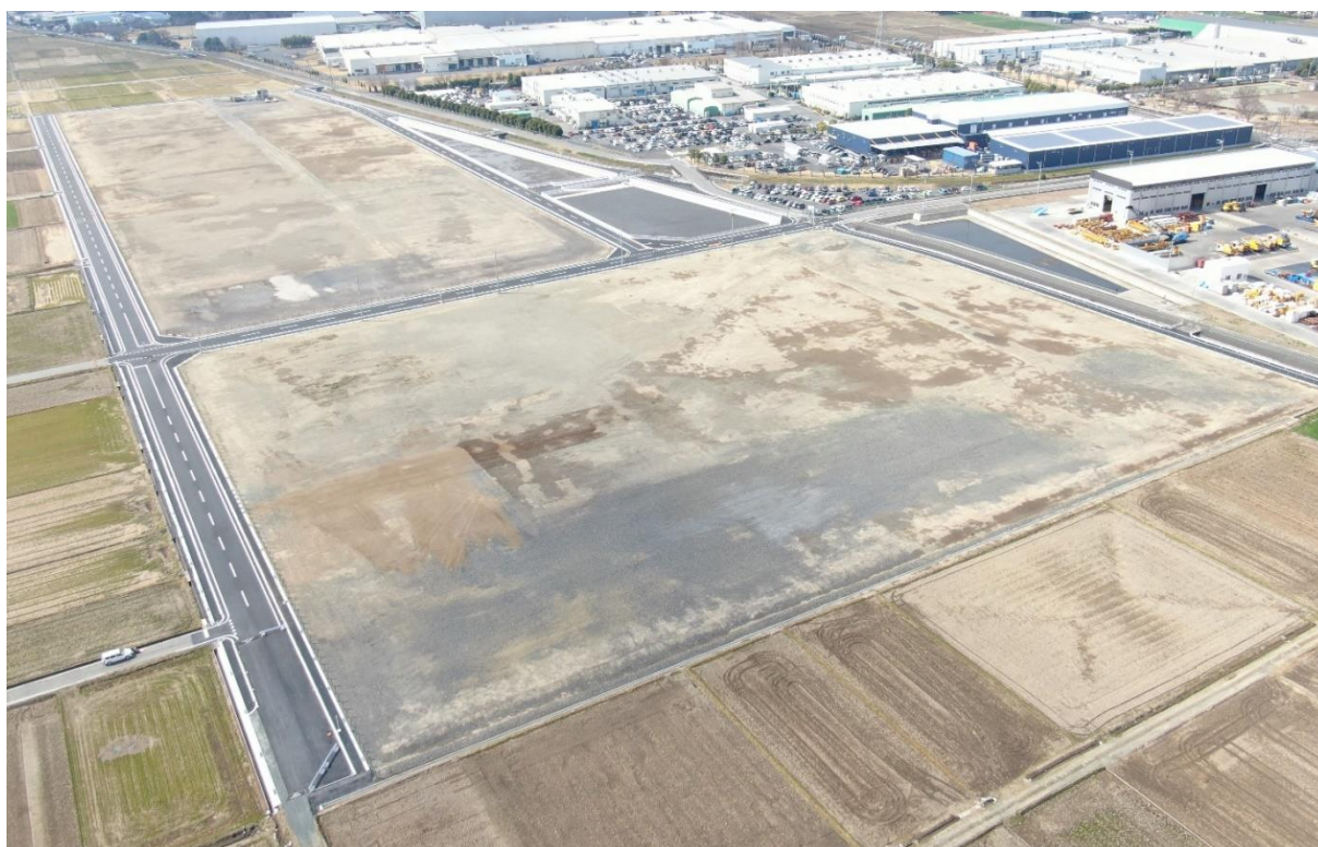
千代田第二工業団地