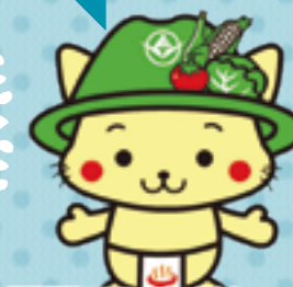
長野県マスコットキャラクターにゃがのはら

浅間山北麓地域が日本ジオパークに認定されました。浅間山の歴史を学びながら、浅間高原の自然を満喫してみませんか。